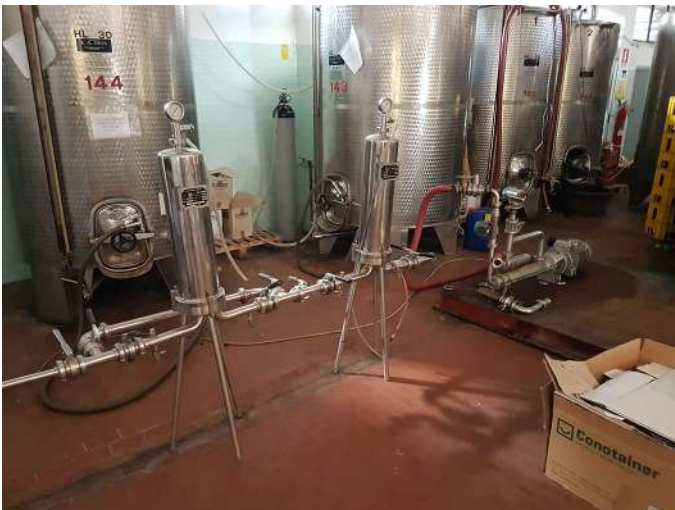
sala imbottigliamento int (2).jpg