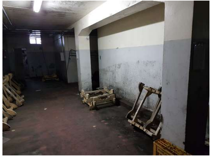
area serbatoi cemento P-1.jpg