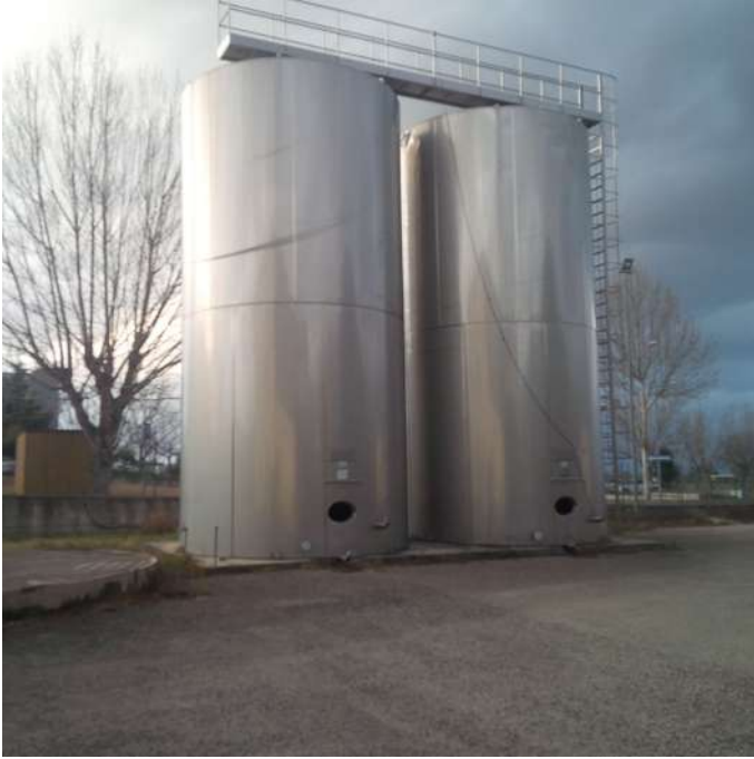
serbatoi ester lato nord.jpg