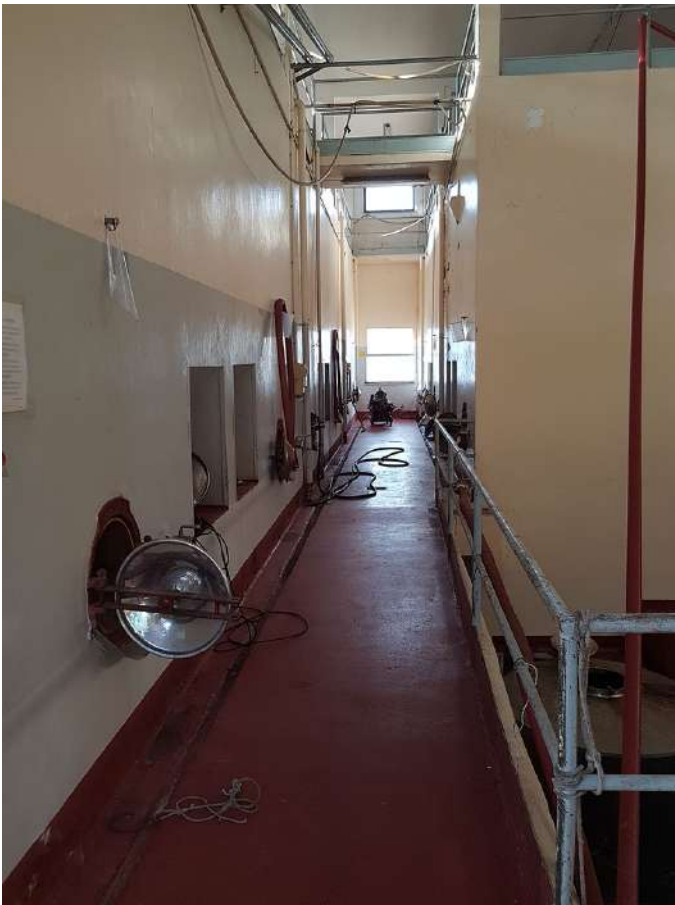
area serb cemento int P1.jpg