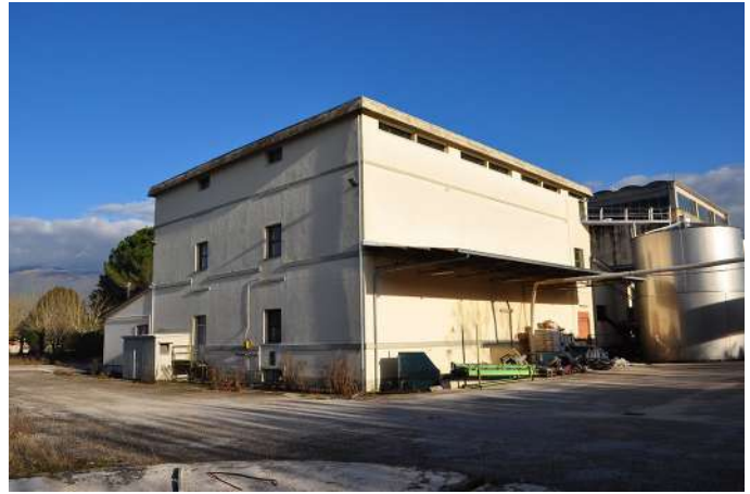
cantina prospetto nord ovest.JPG