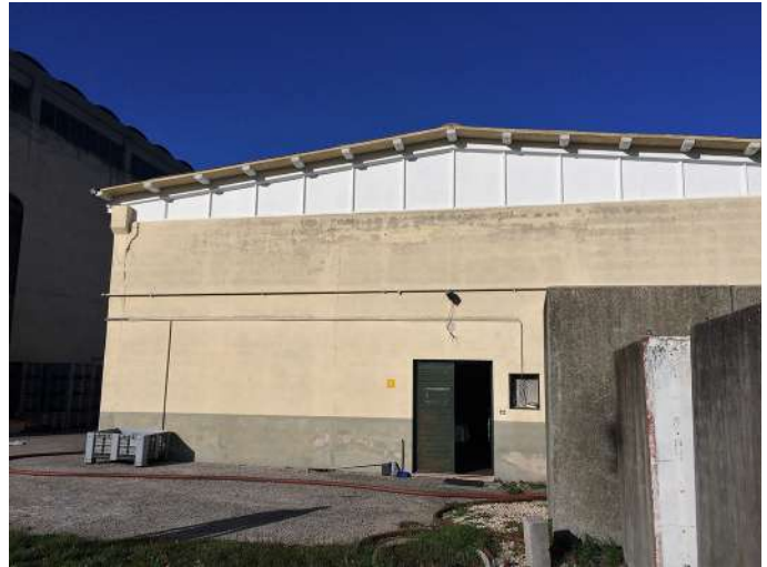
magazz frantoio labor prospetto ovest.JPG