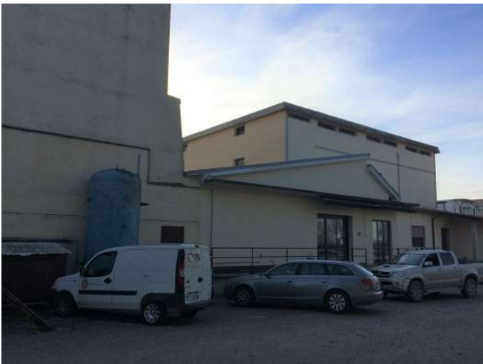
cantina prosp sud est (2).JPG