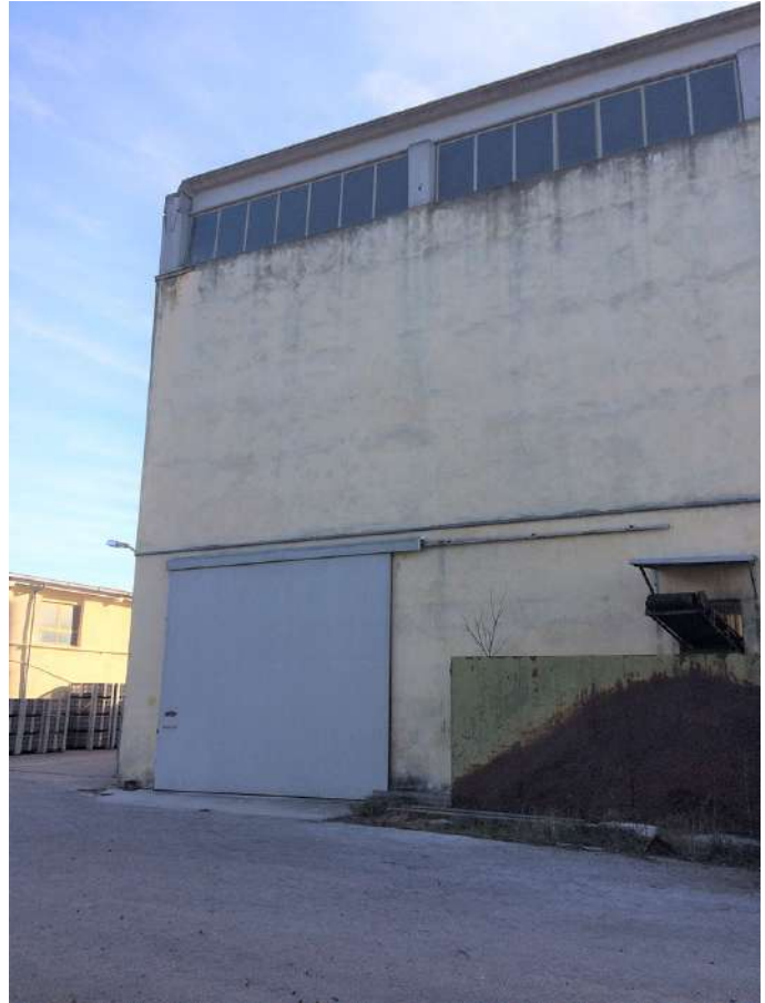
cantina prosp sud est.JPG