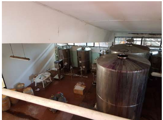
sala imbottigliamento int.jpg