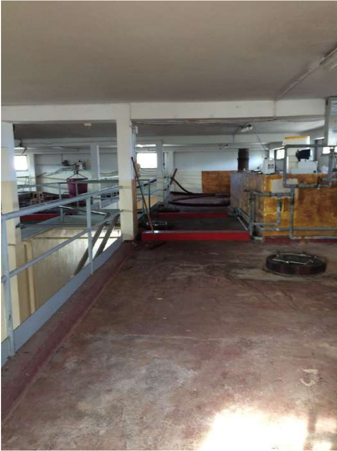
area serbatoi cemento 3P.JPG