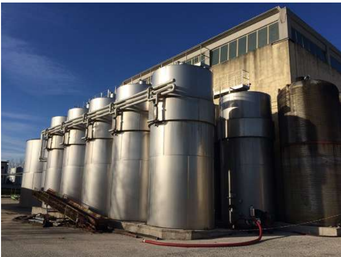
cantina serbatoi esterni prop sud ovest.JPG