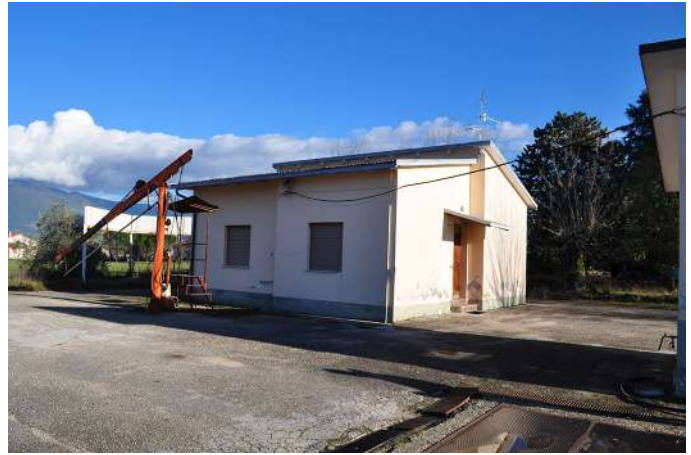
casa del custode.JPG