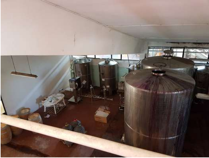
sala imbottigliamento int.jpg