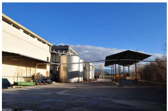
cantina prosp ovest.JPG