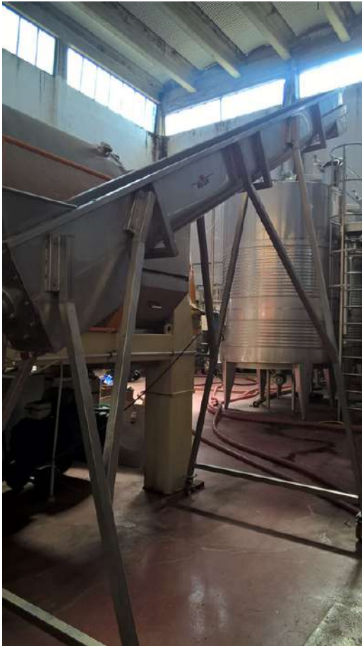
sala vinificazione interni (2).jpg