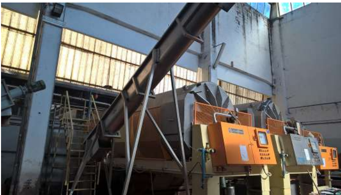
sala vinificazione interni.jpg