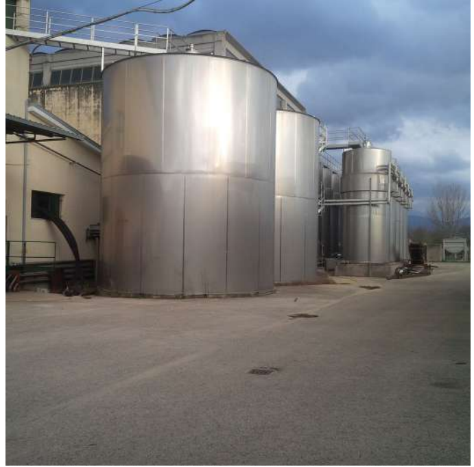
serbatoi ester lato ovest.jpg