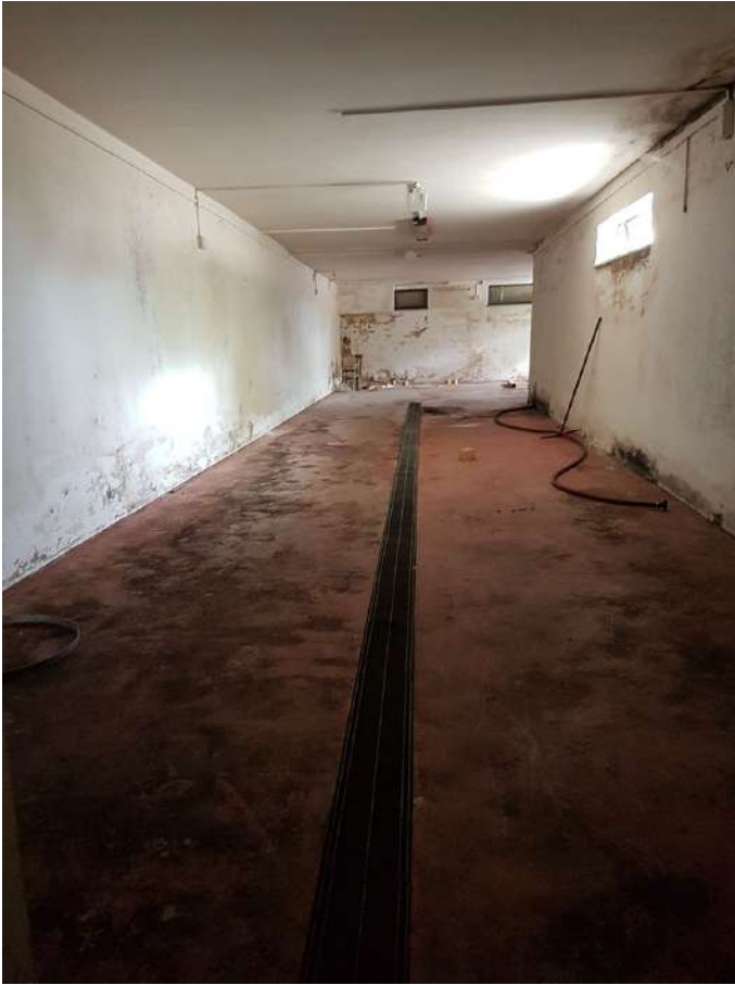
piano interrato bottaia (1).jpg