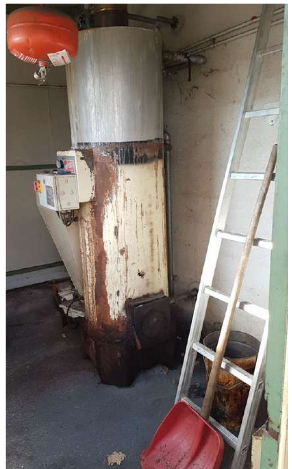
centrale termica frantoio.jpg