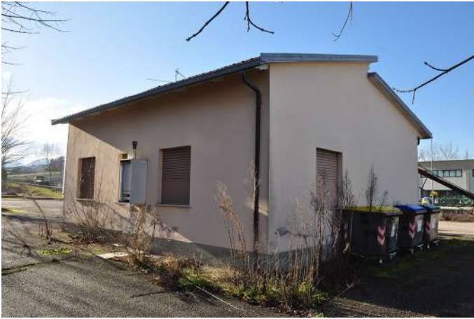
casa del custode (2).JPG