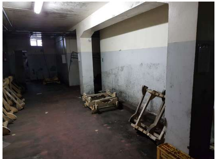
area serbatoi cemento P-1.jpg