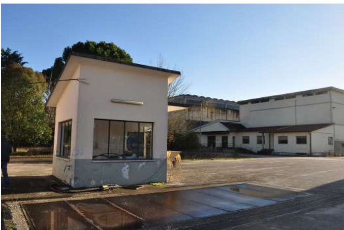
locale pesa (2).JPG