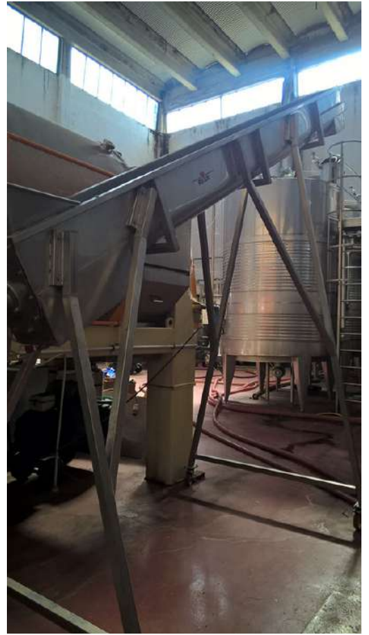
sala vinificazione interni (2).jpg