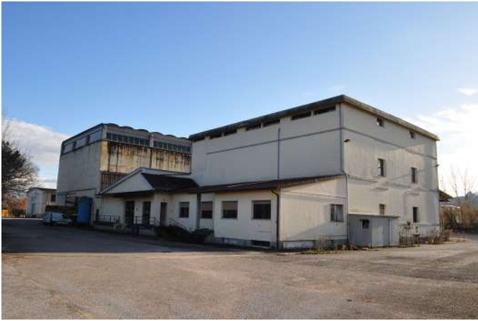
cantina prospetto nord est.JPG