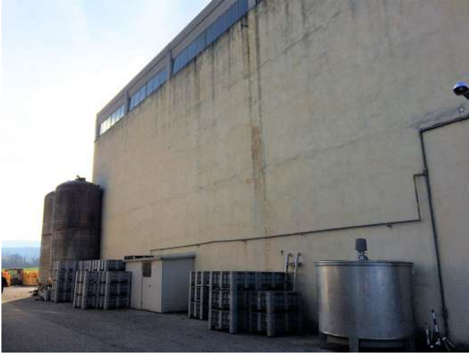
cantina prospetto sud.JPG