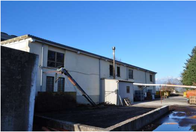
magazzino frantoio laboratorio prosp sud.JPG