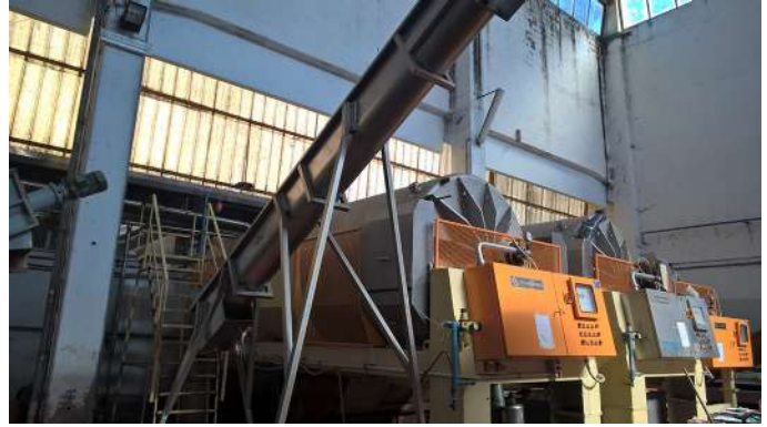
sala vinificazione interni.jpg