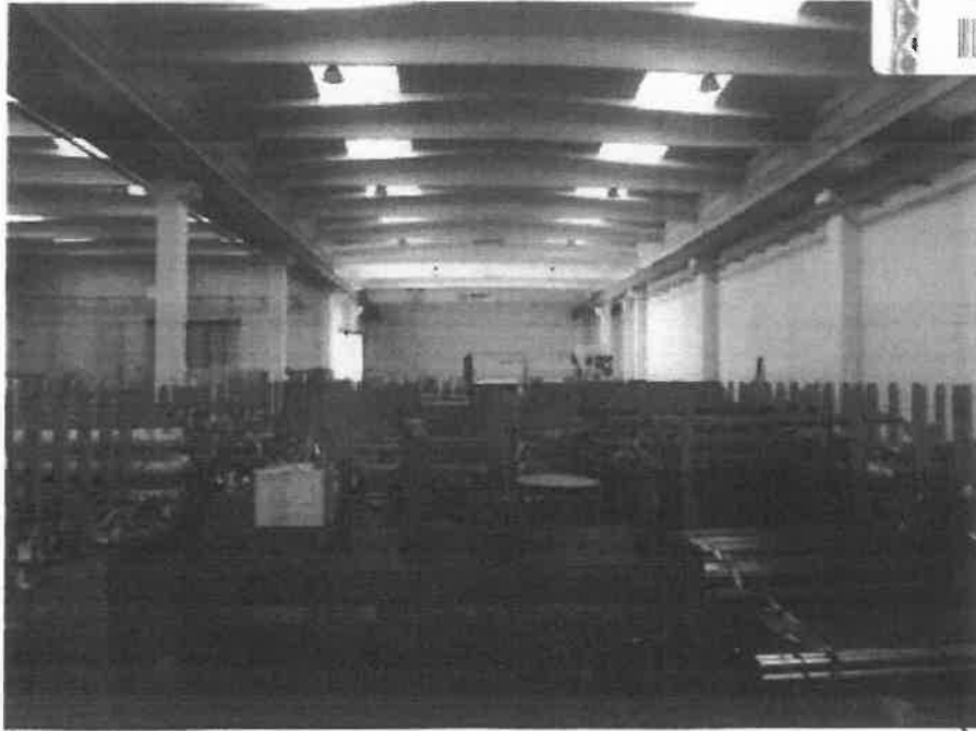
1 - zona magazzino - vista generale