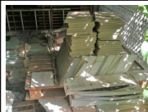
#40: Stock di Materiale Edile