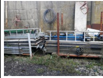
#27: Elementi per Trabatelli