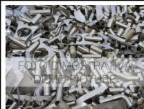
#57: Materiale Ferroso Vario