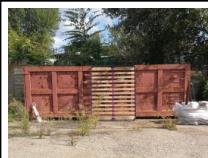
#41: Container in Ferro