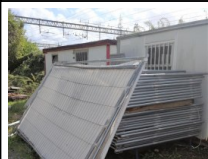
#42: Transenne e Pannelli