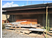
#34: N. 4 Travi in Legno