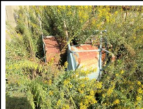
#35: Attrezzatura da Cantiere