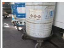
#59: N. 9 Pedane in Metallo