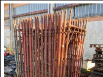
#6: Attrezzatura da Cantiere e Ufficio