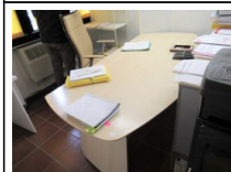
#2: Arredi e Attrezzature per Ufficio