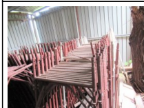
#4: Impianti e Attrezzature