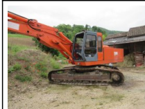
#3: Mezzi d'Opera