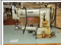
#116: N. 1 PFAFF attacca bottoni