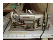
#107: N. 2 PFAFF