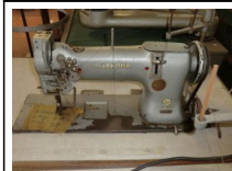
#105: N. 1 DURKOPP