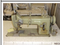
#101: N. 1 NECCHI 2 aghi