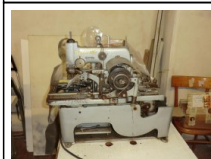
#95: N. 2 DURKOPP asolatrice