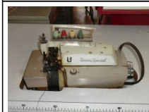
#117: N. 1 TC-UNION SPECIAL