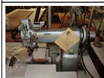
#112: N. 1 DURKOPP