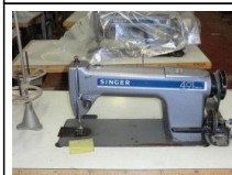
#97: N. 6 SINGER lineare