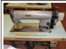
#96: N. 12 PFAFF lineare