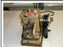
#121: N. 1 BONIS macchina per giunture