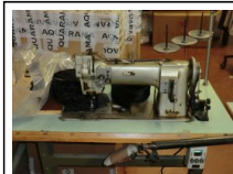
#93: N. 3 PFAFF 2 Aghi