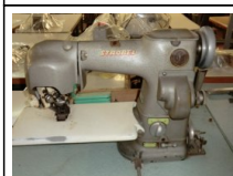
#110: N. 2 STROBEL