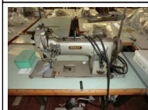
#109: N. 3 PFAFF