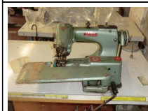
#99: N. 1 LEWIS sottopunto