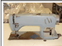
#100: N. 1 Lineare 770