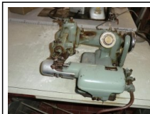
#113: N. 1 BLIND STITCH