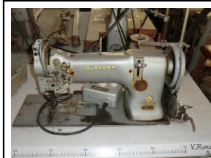
#114: N. 1 DURKOPP