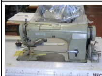
#98: N. 5 NECCHI lineare