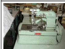
#106: N. 1 REECE asolatrice