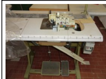
#104: N. 1 RIMOLDI 5 fili taglia-cuci