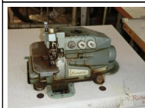
#108: N. 3 RIMOLDI taglia-cuci