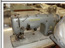
#111: N. 2 DURKOPP