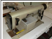
#118: N. 1 PFAFF 548