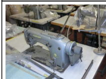
#94: N. 25 DURKOPP lineare