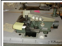
#119: N. 2 RIMOLDI taglia-cuci