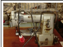
#120: N. 2 PFAFF attacca maniche