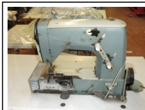
#103: N. 1 RIMOLDI