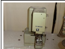
#115: N. 1 NECCHI travettatrice