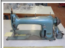
#102: N. 1 BORLETTI lineare