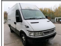
#11: Furgone IVECO 35C17 HPT

Marca: IVECO Modello: 35C17 Hpt Anno: 2005